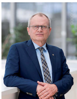
Ulrich Lilie ist Präsident der Diakonie Deutschland.

Seit 2011 besteht die Projektpartnerschaft Kirche findet Stadt zwischen dem Deutschen Caritasverband und der Diakonie Deutschland. Was als zeitlich befristetes Experiment einer ökumenischen Plattform begann, wurde zu einem Erfolgsmodell der kontinuierlichen Zusammenarbeit zwischen den beiden Verbänden. Gemeinsam wurde „der Stadt Bestes“ (Jeremia 29, 7) gesucht, um eine Verbesserung der Lebensverhältnisse für Menschen vor Ort zu erreichen. Wenn dies gelingen soll, ist es notwendig, die Menschen mit ihren Nöten und Ideen, aber auch in ihren Netzwerken und Nachbarschaften als Teil integrierter sozialer Stadtentwicklung einzubeziehen. Von Anfang an wurde daher die enge Zusammenarbeit zwischen den verbandlichen Akteuren von Diakonie und Caritas mit den Kirchengemeinden vor Ort gepflegt.